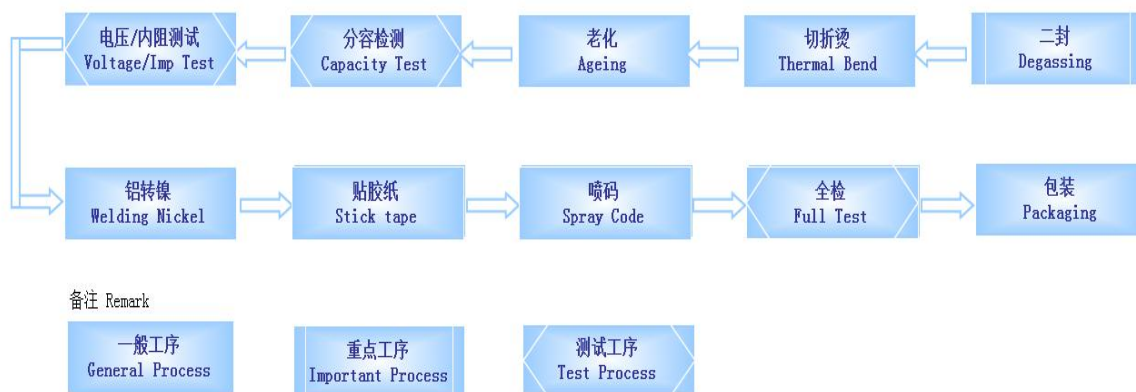
图 1 厂区 5 楼工艺流程图