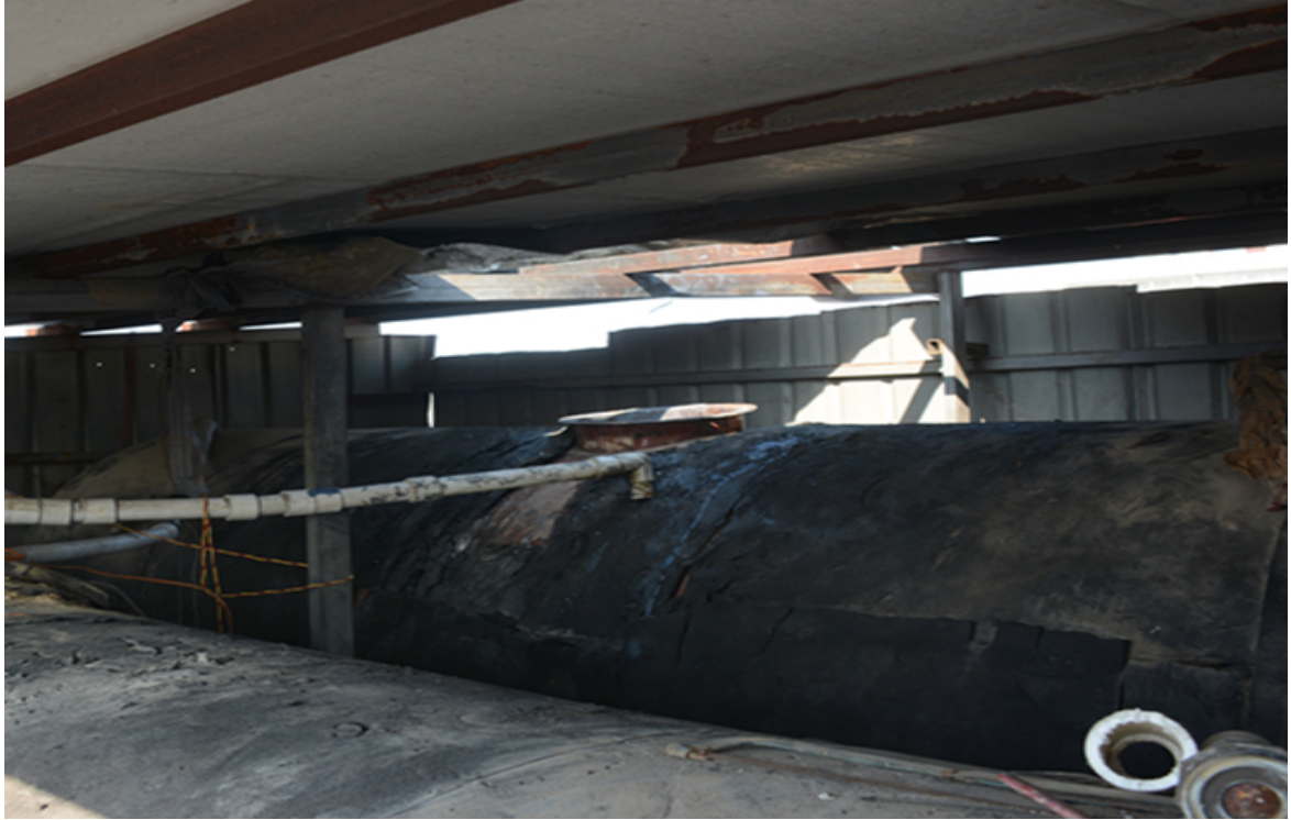
图 4 简易水塔处停用储水罐（西南向东北拍摄）