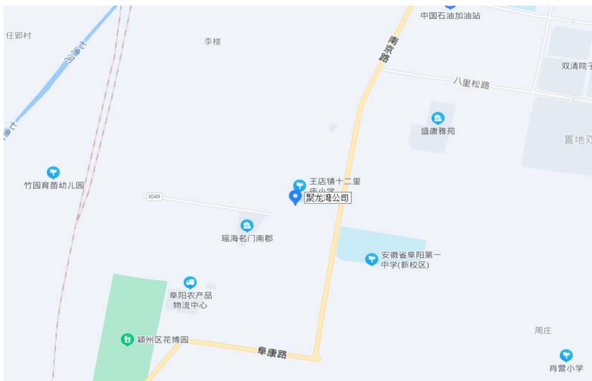
图 1 聚龙湾公司方位图（蓝色标记处为事故发生地）

聚龙湾公司大门朝北，沿路为二层砖混结构楼房，楼顶搭建有板房，由大门进入院内，院子西侧为二层板房建筑，南侧为一层砖混结构建筑，浴场位于院子北侧，东侧搭建有一座简易水塔，其顶端离地面约 9 米（见图 2）。水塔由钢架支撑，上部搭建的铁皮房锈蚀严重，其南侧有一个铁质梯子，通过一层砖混结构建筑屋顶直达水塔顶部铁皮房。铁皮房顶部由北向南倾斜，北侧高 2.4 米，南侧高 2.1 米，南北长 4.6 米，东西长 5.6 米，房内安装有两个圆形储水罐，均呈东西向摆放（见图 3）。其中南侧在用储水罐长 4.56 米，直径约 1.4 米。事故发生在北侧停用储水罐内，其长 4.6 米，直径约 1.6 米，顶部中央有一个内径为 0.39 米的圆形罐口，离房顶高约 0.8 米（见图 4）。向罐内观察，内部有