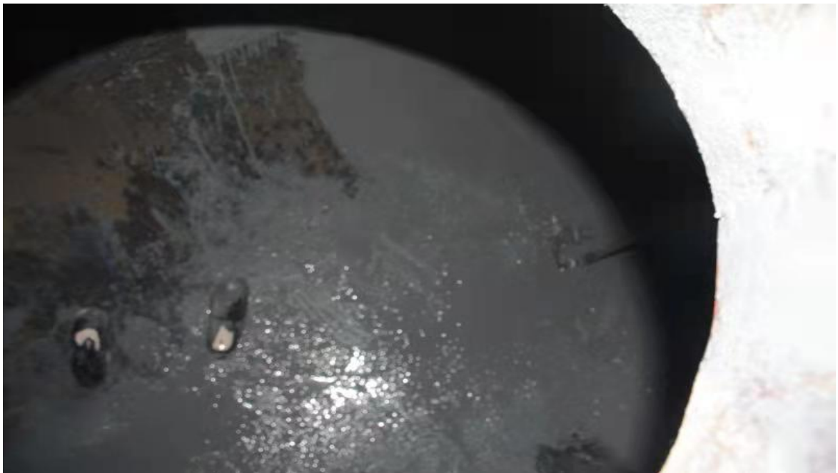
图 5 事故发生后储水罐内部（罐口向内拍摄）