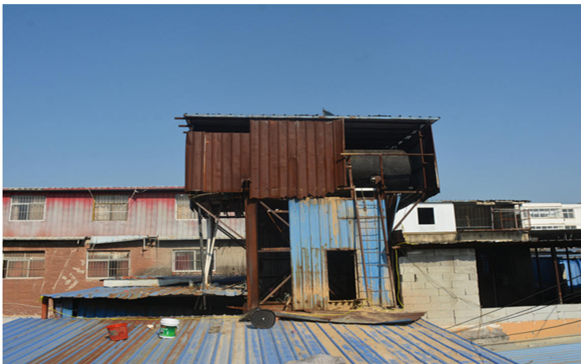
图 3 聚龙湾公司简易水塔（南向北拍摄）